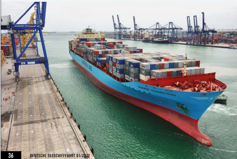
CONTAINERRIESE: „Einige Linienreeder liefern sich einen selbstzerstörerischen und überflüssigen Preiskampf.“

LAMMERSKÖTTER: Zunächst einmal: Die Fundamentaldaten der Schifffahrt stimmen.